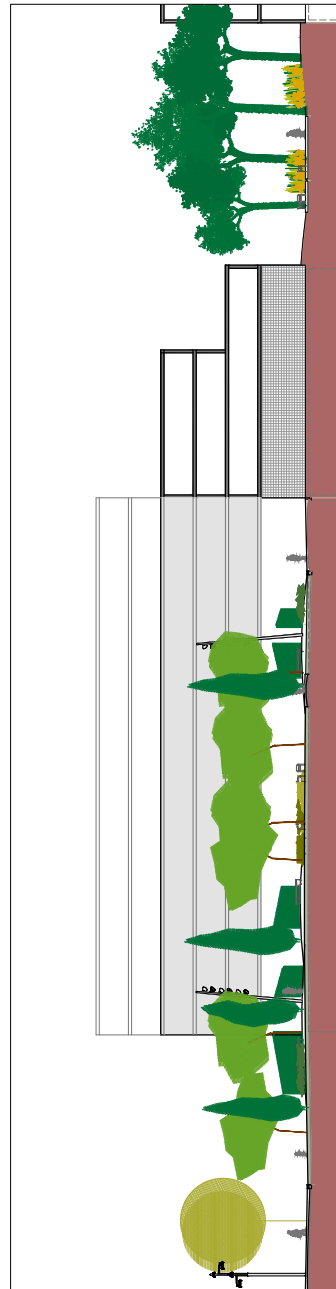
SECCIÓ CONJUNT PLAÇA