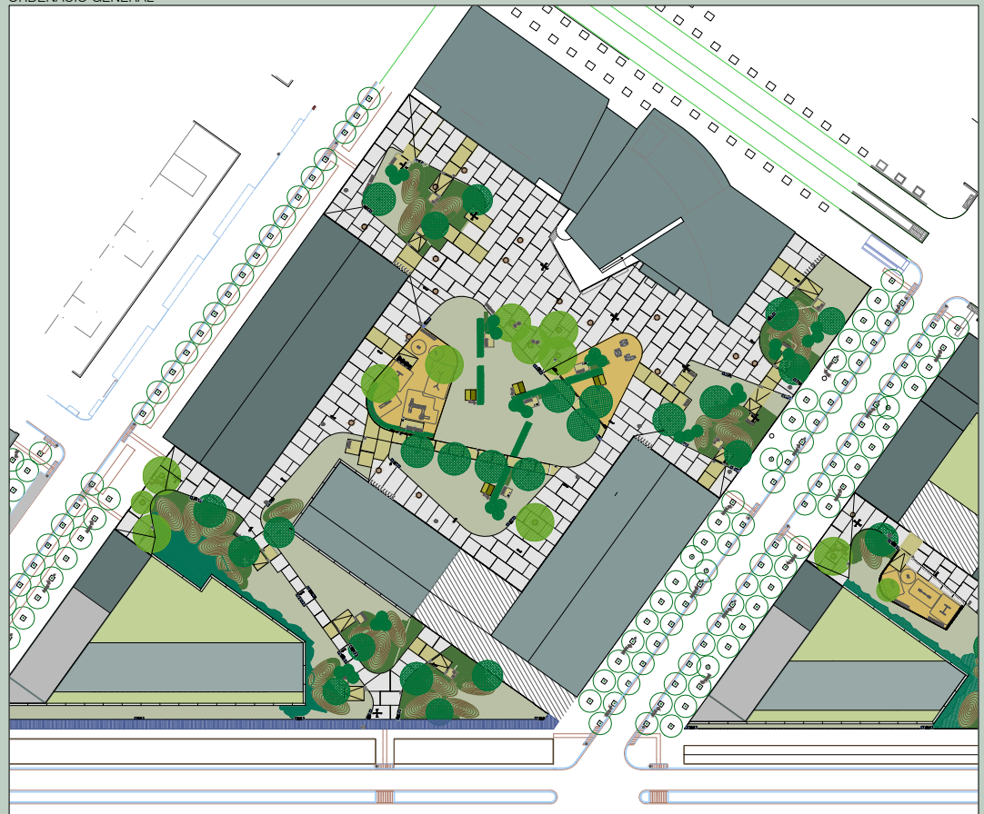
PLAÇA DEL CENTRE CÍVIC